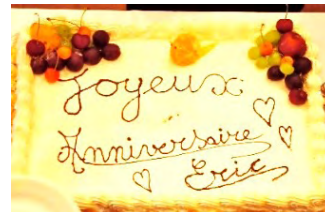
特大バースデーケーキ