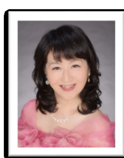
平川玲子(ソプラノ)