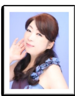
八方久美子(ソプラノ)